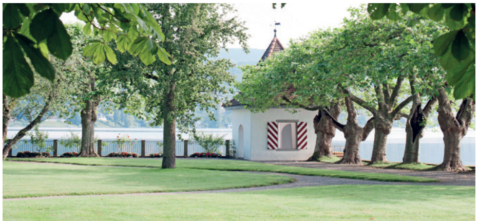
Die öffentlichen Bereiche sind von einer einladenden Atmosphäre geprägt.

Die Frührehabilitation (überwachungs-pflichtige Rehabilitation) ist speziell auf die besonderen Bedürfnisse erheblich beeinträchtigter Patienten zugeschnitten. Deren medizinische Instabilität muss ärztlich und pflegerisch intensiver überwacht und betreut werden. In dieser Phase werden die therapeutischen Anwendungen exakt der eingeschränkten Belastbarkeit angepasst