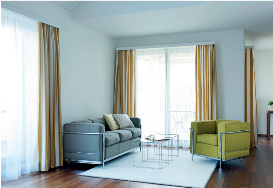
Komfortables Raumgefühl und eine weitläufige Privatsphäre.