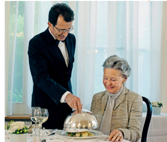
Kulinarischer Genuss in passend stilvollem Ambiente.